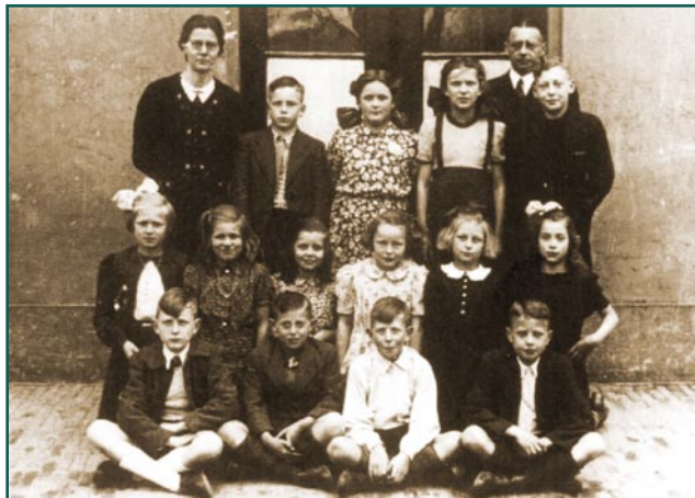
Dit klasje had les in het oude station anno 1948.

Een aantal oud bewoners is inmiddels bij ons bekend. U kunt reageren per email naar: info@stationopwielen.nl of contact opnemen met Jantine Sijbring projectleider gemeente Houten 030-6392839.