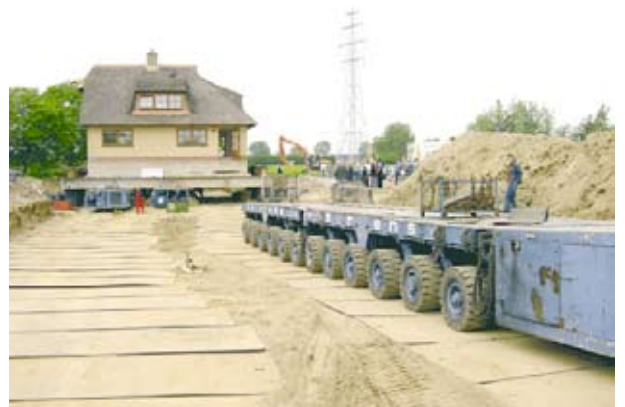
Voorbeeld van een vergelijkbaar project: een woonhuis op wielen!